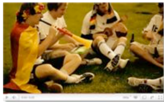
Videobeispiel 2, „Uwu Lena - Schland o Schland“

http://www.youtube.com/watch?v=Vscg_QeKdpI