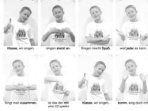
Bewegungschoreografie: Klasse, wir singen

Mit Hilfe einer DVD wird versucht, den LehrerInnen eine musikpädagogische Grundausbildung bis hin zur Stimmbildung zu vermitteln. Darüber hinaus wurden 60 LehrerInnen aus Niedersachsen geschult, die in jedem Landkreis Fachbildungen anbieten.